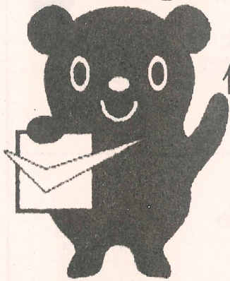
最低賃金制度のマスコット チェックマン