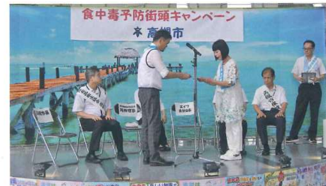
高槻支部 7月3日 JR高槻駅アクトアモレ周辺

地域の保健所と正会員（支部）の皆さまが協力し、食中毒予防街頭キャンペーン等を開催されました。富田林支部は11月2日に富田林市市民会館にてキャンペーンを実施されました。（写真無し）