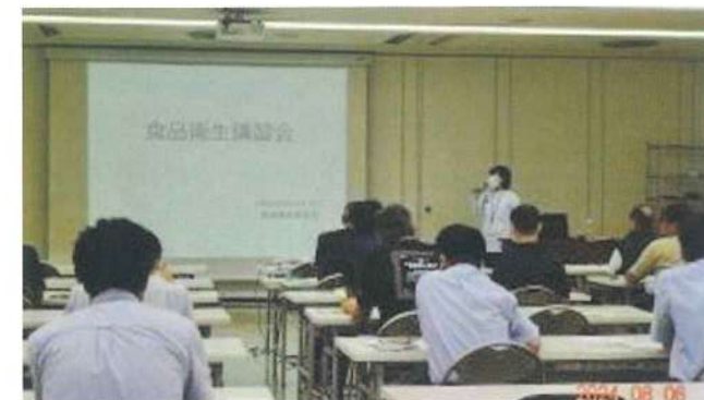
中央卸売市場支部 8月6日 大阪府中央卸売市場 管理棟7階