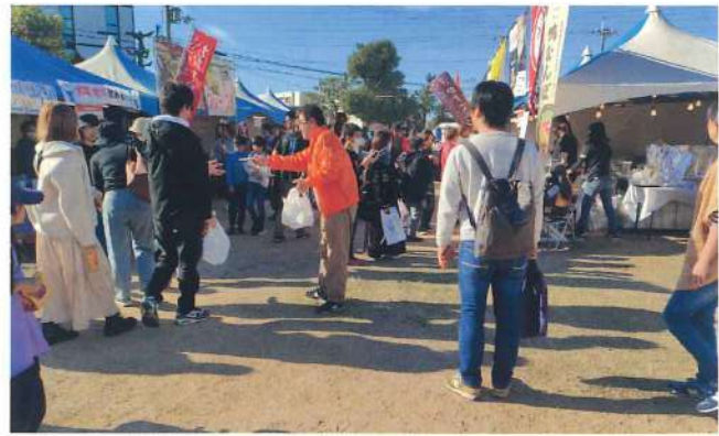
松原支部 11月9日 松原中央公園