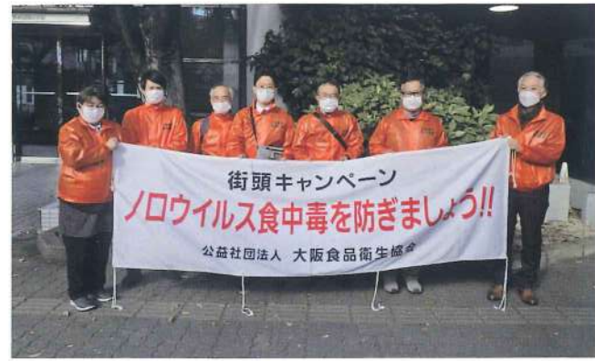
港・西淀川・大正・福島・西・此花支部 11月29日 イオン野田阪神ウイステ