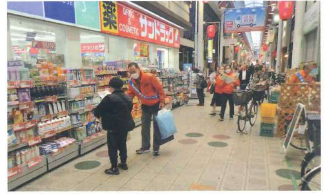
阿倍野・東住吉・平野支部 11月20日 駒川商店街