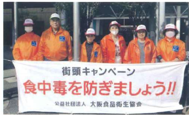
泉大津支部 11月4日 泉大津駅前(山側)