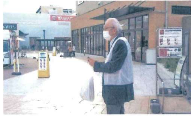
岸和田支部 11月12日 そよら東岸和田前