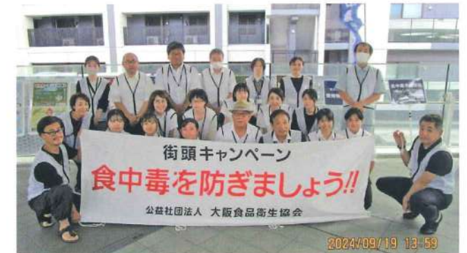
茨木支部 9月19日 いばらきスカイパレット2階