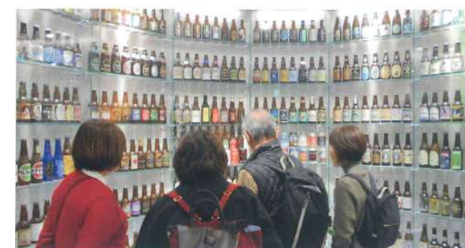
守口・門真支部 11月22日 黄桜伏水蔵