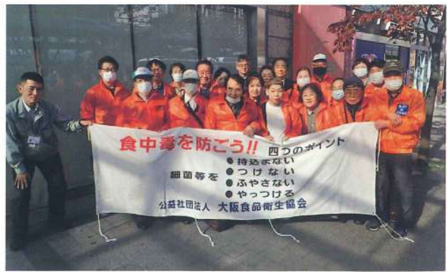
寝屋川支部 11月11日 京阪寝屋川市駅前