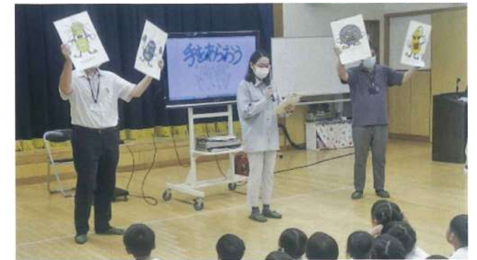
尾崎支部 7月17日 泉南市立くすのき幼稚園