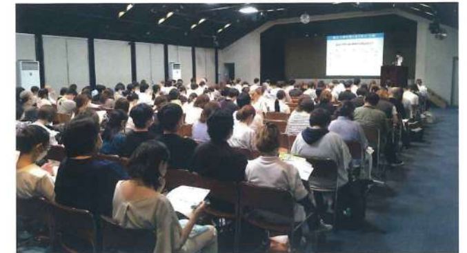
藤井寺支部 9月4日 藤井寺市民会館別館中ホール