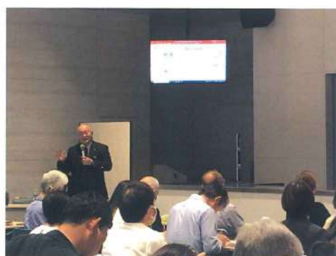
講習会動画 (2025年3月末まで掲載予定)