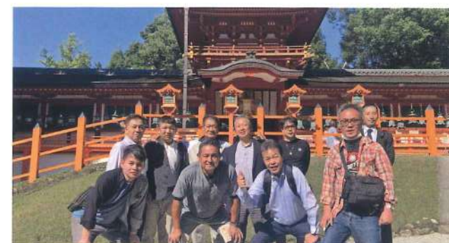
泉佐野支部 10月21日 イゲタ醤油 井上本店