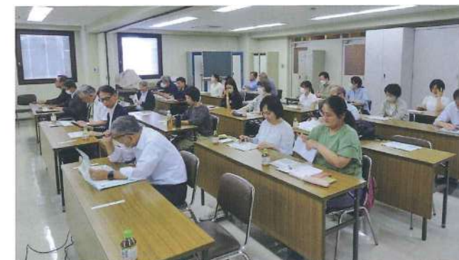
北支部 9月12日 大阪料理館ビル