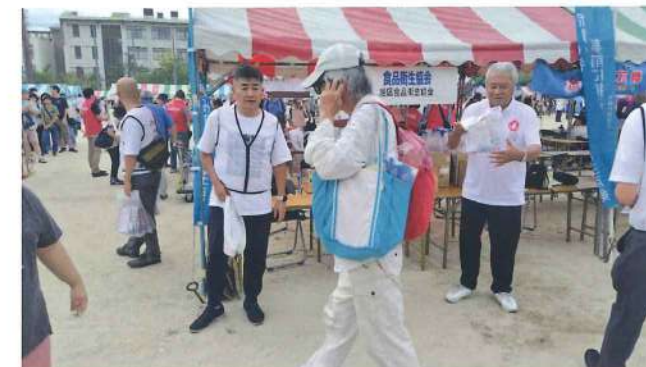
旭支部 9月28日 旭区民祭り