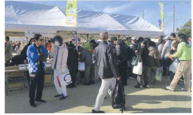
狭山支部 11月23日 大阪狭山市立野球場