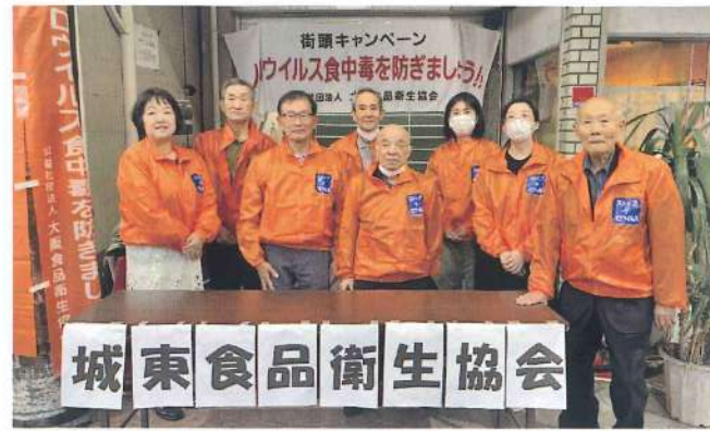
城東支部 10月26日 城東商店街城東市場