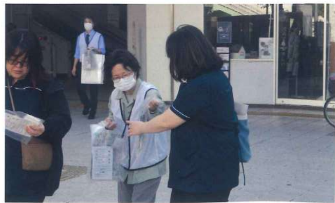
八尾支部 11月11日 近鉄八尾駅前