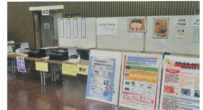
住之江・住吉・西成支部 10月19日 西成区健康展