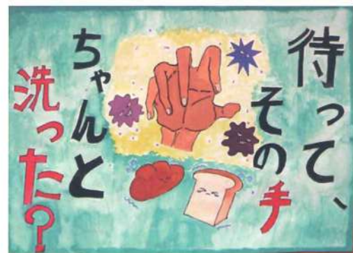
大阪市長賞 金沢 晴花