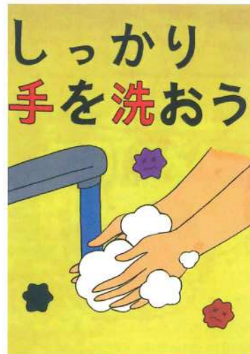
大阪府知事賞 江浪 雛