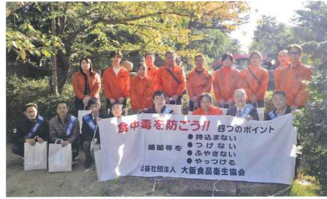
住之江・住吉・西成支部 11月21日 粉浜商店街