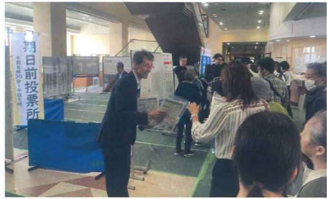
藤井寺支部 10月20日 羽曳野市立総合スポーツセンター はびきのコロセラム