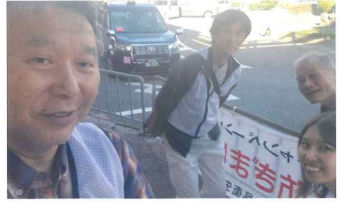
柏原支部 11月13日 近鉄国分駅東口