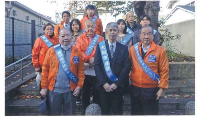
生野支部 12月4日 桃谷駅周辺・桃谷中央商店街