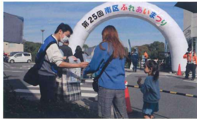
堺支部 11月10日 第25回南区ふれあいまつり