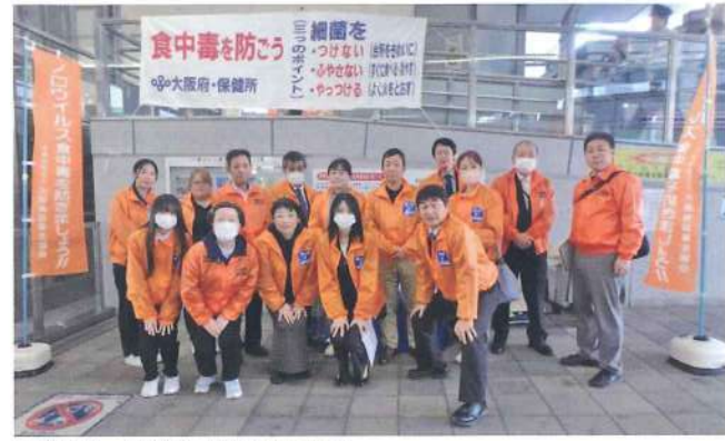
泉佐野・関西国際空港支部 11月13日 南海泉佐野駅