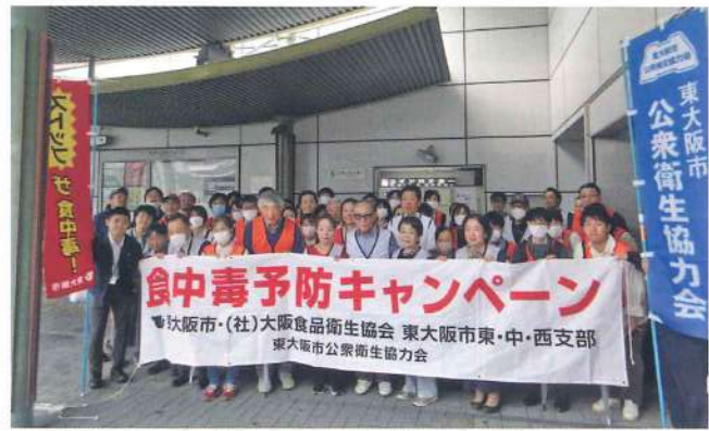
東大阪市東・東大阪市西・東大阪市中支部 10月29日 近鉄瓢箪山駅南側せせらぎ広場