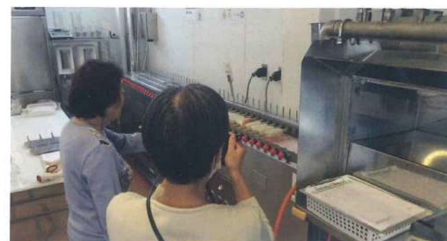
藤井寺支部 11月7日 カネテツデリカフーズ