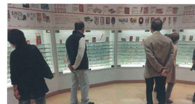
松原支部 10月22日 神戸酒心館、わくわくファクトリーグリコピア神戸